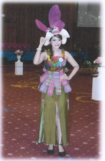
รามคำแหงรวมใจเทิดไท้พระคุณแม่