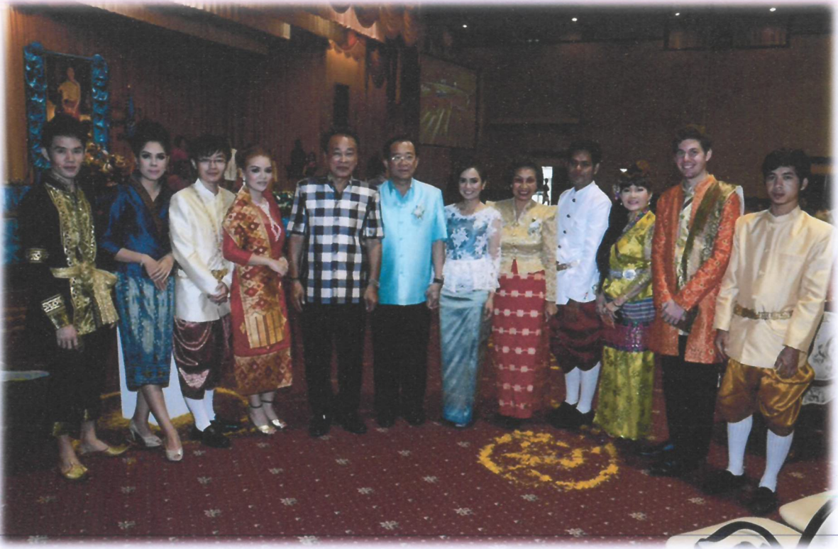
ประกวดการแต่งกายด้วยผ้าไทยเทิดไท้มหาราชินี