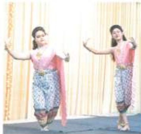
การแสดงชุดที่ ๓ “สีนวลออกอาหนู” จากชมรมดนตรีไทยและนาฏศิลป์ มหาวิทยาลัยรามคำแหง