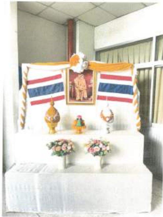
กองแผนงาน