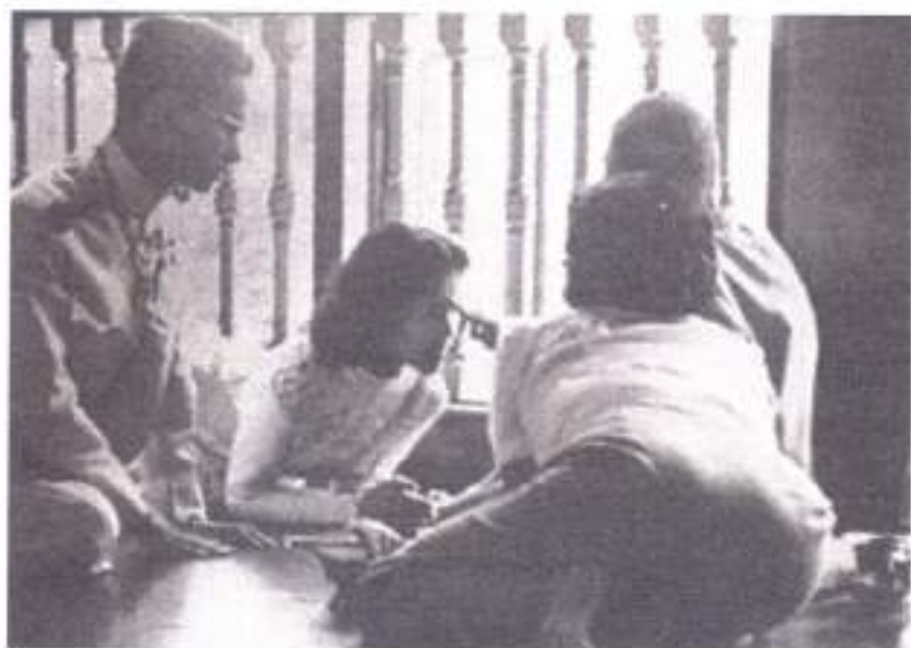
วันที่ ๒๘ เมษายน ๒๕๑๓ พระราชพิธีราชาภิเษกสมรส สมเด็จพระพันวัสสาอัยยิกาเจ้า พระราชทานน้ำพระมหาสังข์ ณ วังสระปทุม