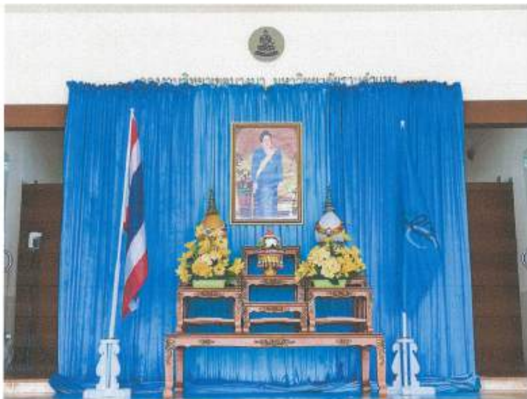
กองงานวิทยาเขตบางนา