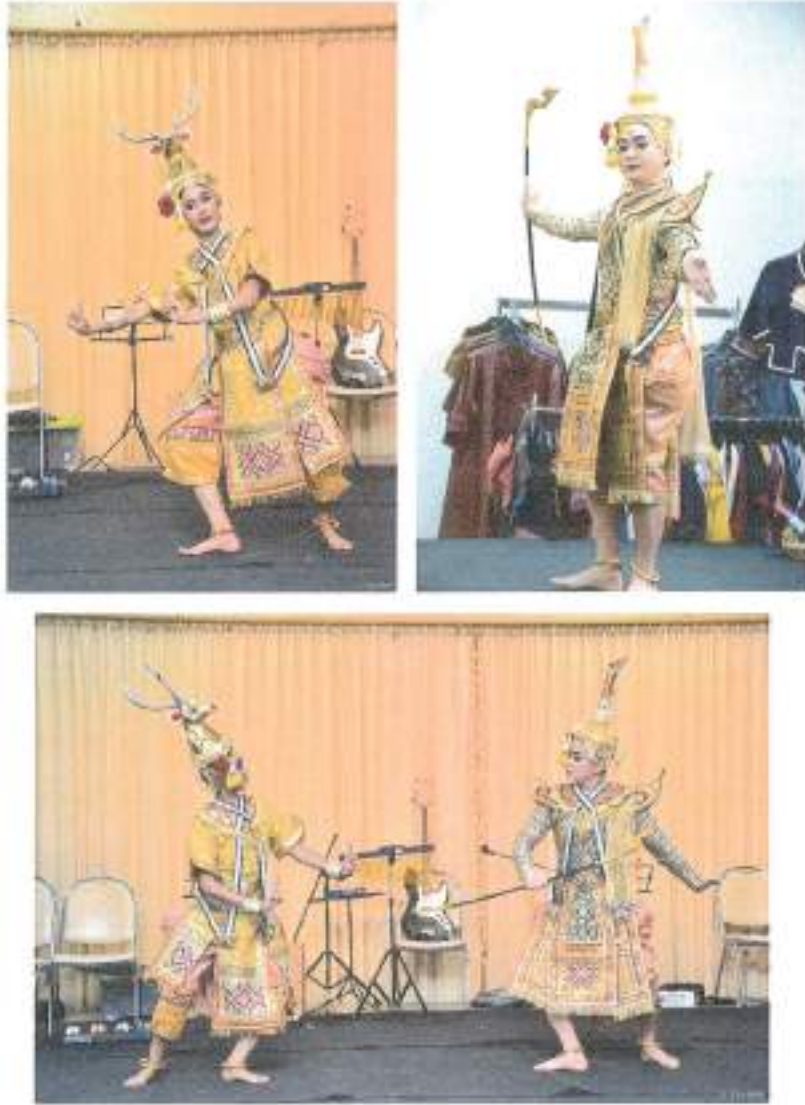
การแสดงชุดที่ ๓ "พระรามตามกวาง" จากชมรมดนตรีไทยและนาฏศิลป์ มหาวิทยาลัยรามคำแหง