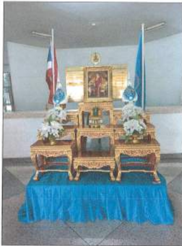
คณะเศรษฐศาสตร์