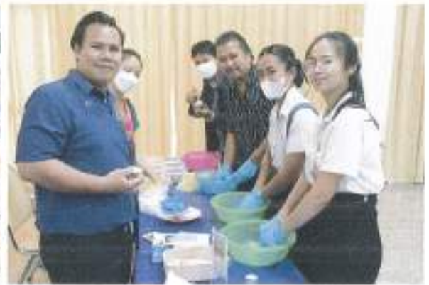
การสาธิตการทำขนมสมุนไพร