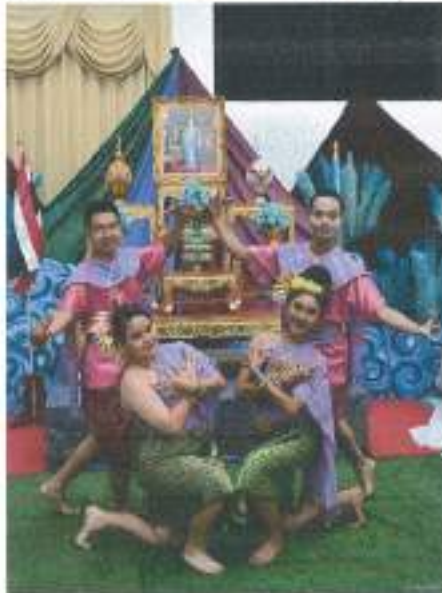
การแสดงชุดที่ ๓ “เซิ้งโปงลาง” จากชมรมดนตรีไทยและนาฏศิลป์ มหาวิทยาลัยรามคำแหง