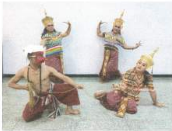
การแสดงแสงชุดที่ ๒ "โนราใต้" จากชมรมดนตรีไทยและนาฏศิลป์ มหาวิทยาลัยรามคำแหง