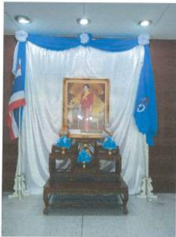
คณะรัฐศาสตร์