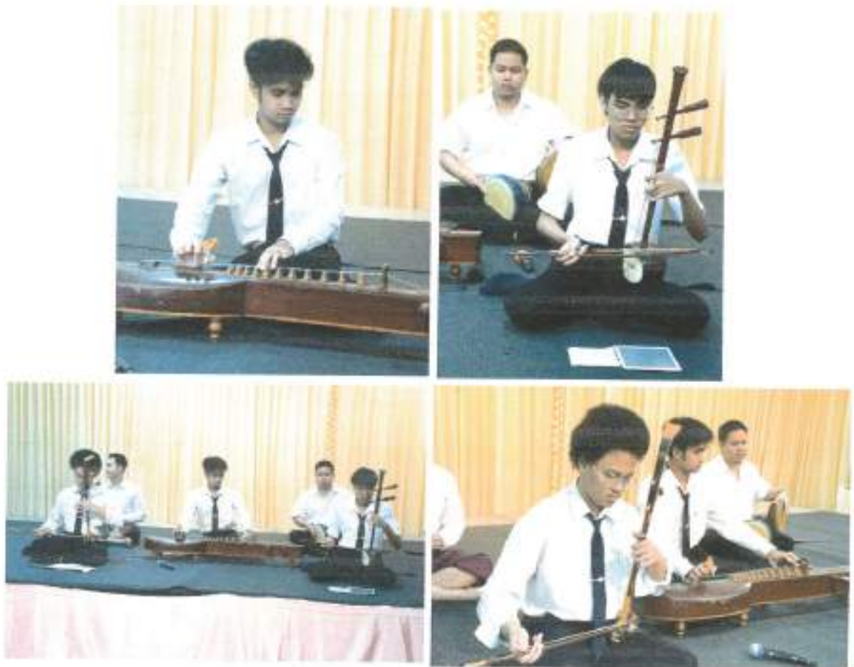
การแสดงบรรเลงดนตรีไทย จากนักศึกษาชมรมดนตรีไทยและนาฏศิลป์ มหาวิทยาลัยรามคำแหง