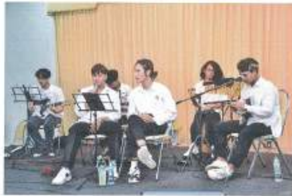
การแสดงดนตรีโฟล์คซอง จากนักศึกษาสาขาดนตรีสากล ชั้นปีที่ ๒ คณะศิลปกรรมศาสตร์ มหาวิทยาลัยรามคำแหง