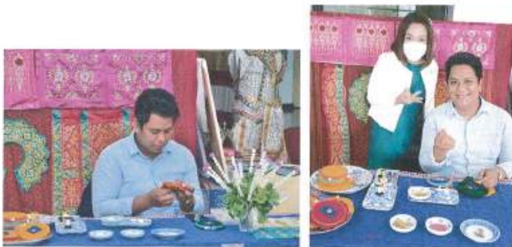
การสาธิตงานปักผ้าด้วยดินเหนียว