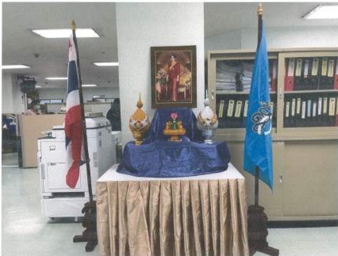
สถาบันบริการวิชาการทางอิเล็กทรอนิกส์