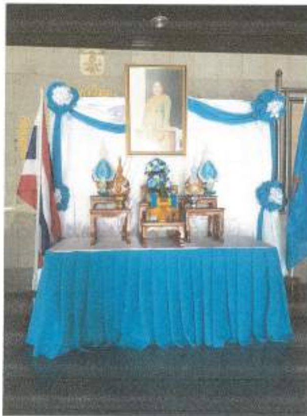
โรงเรียนสาธิตมหาวิทยาลัยรามคำแหง (ฝ่ายประถม)