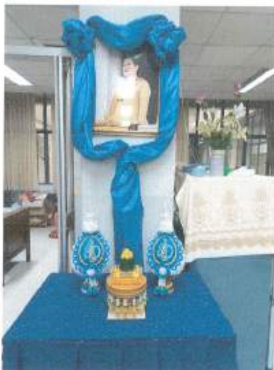
กองการเจ้าหน้าที่ สำนักงานอธิการบดี