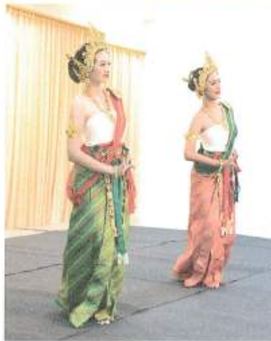
การแสดงชุดที่ ๓ “ศรีวิชัย” จากชมรมดนตรีไทยและนาฏศิลป์ มหาวิทยาลัยรามคำแหง