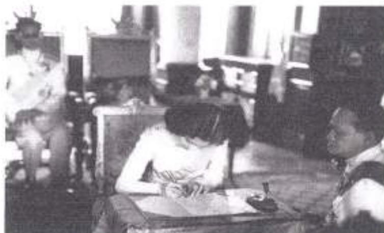
วันที่ ๒๘ เมษายน ๒๔๙๓ ทรงลงพระนามาภิไธย ในสมุดทะเบียนสมรส