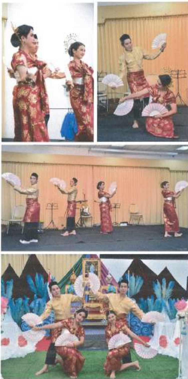
การแสดงชุดที่ ๒ “ตารีก็ปัส” จากชมรมดนตรีไทยและนาฏศิลป์ มหาวิทยาลัยรามคำแหง