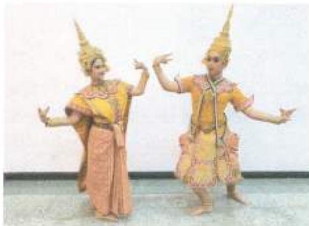
การแสดงชุดที่ ๑ "ดาวดิ่งส์" จากชมรมดนตรีไทยและนาฏศิลป์ มหาวิทยาลัยรามคำแหง