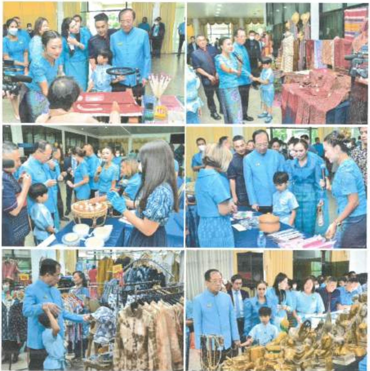
พิธีกร กล่าวเชิญชวนผู้เข้าร่วมงาน เติมนมนิทรรศการเฉลิมพระเกียรติ ประกอบด้วย การสาธิตงานปักผ้าด้วยดินเหนียว การสาธิตชุดแต่งกาย (ผ้าไทย) การสาธิตการทำยาสมุนไพร อีกทั้งมีการจัดจำหน่ายสินค้าศิลปหัตถกรรมของไทย และกิจกรรมสอยดาว