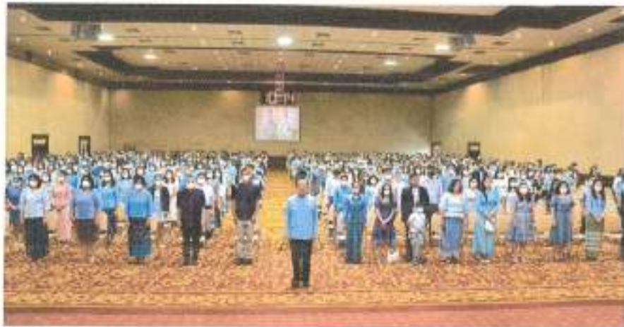
ผู้เข้าร่วมพิธี ร่วมร้องเพลงสรรเสริญพระบารมี