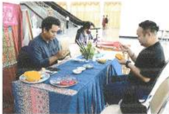
การสาธิตงานปักผ้าด้วยตีนเลื่อม