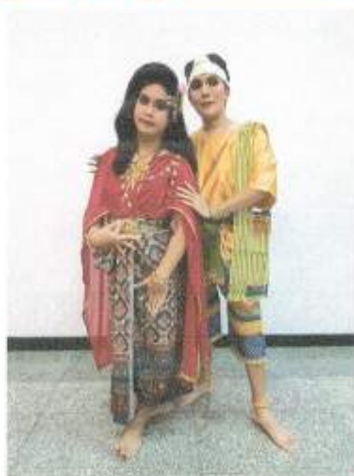
การแสดงชุดที่ ๒ “พลายบัวเกี้ยวนางตานี” จากชมรมดนตรีไทยและนาฏศิลป์ มหาวิทยาลัยรามคำแหง