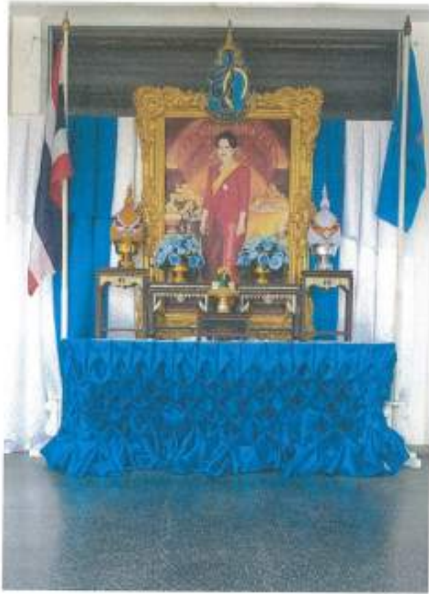
คณะศึกษาศาสตร์