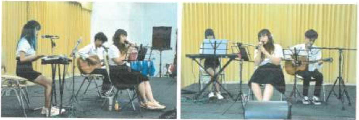
การแสดงดนตรีโฟล์คของ จากนักศึกษาสาขาดนตรีสากล คณะศิลปกรรมศาสตร์ มหาวิทยาลัยรามคำแหง ชั้นปีที่ ๑