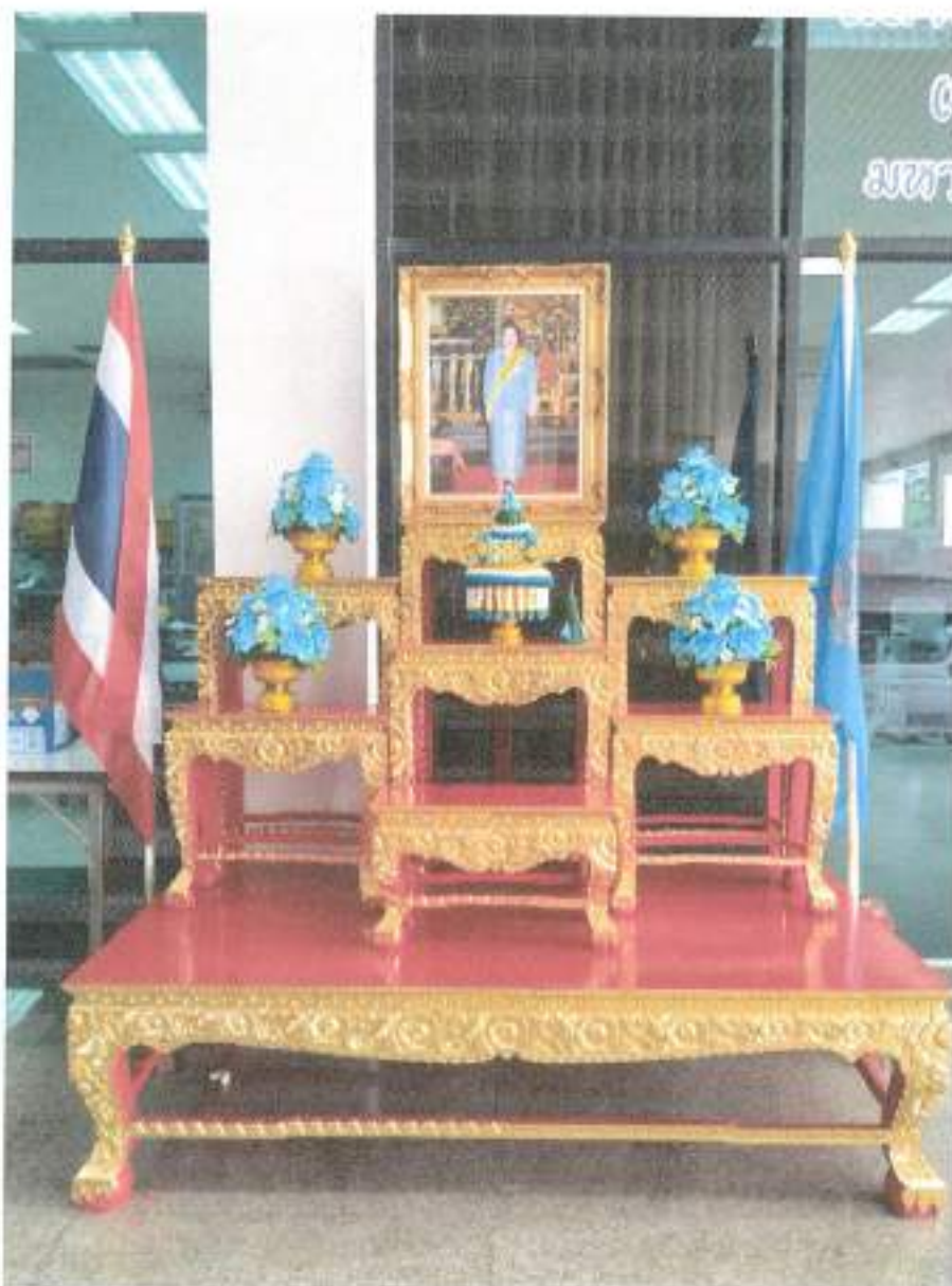
สถาบันศิลปวัฒนธรรมเฉลิมพระเกียรติ