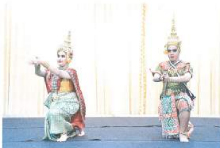
การแสดงชุดที่ ๑ "เทพบันเทิง" จากชมรมดนตรีไทยและนาฏศิลป์ มหาวิทยาลัยรามคำแหง