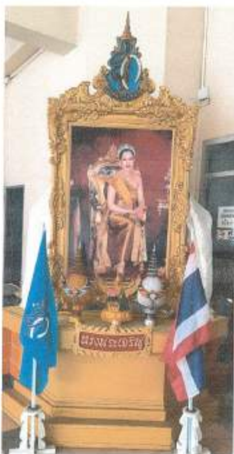
สถาบันคอมพิวเตอร์