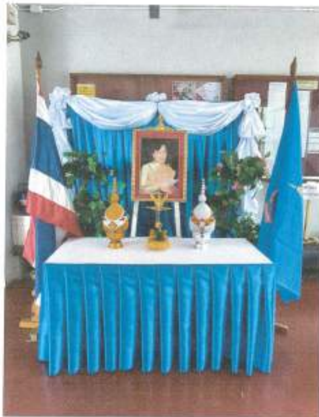
คณะวิศวกรรมศาสตร์