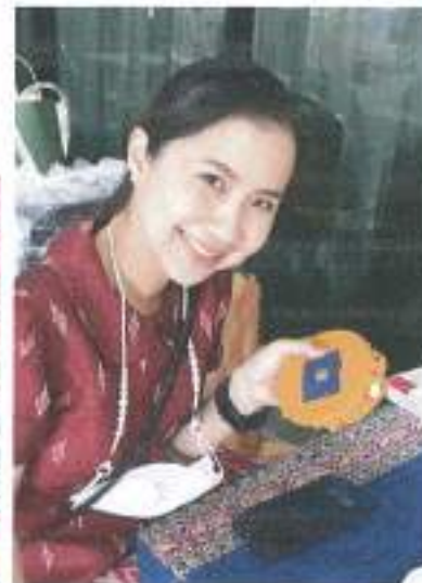
การสาธิตงานปักผ้าด้วยตีนเสียม