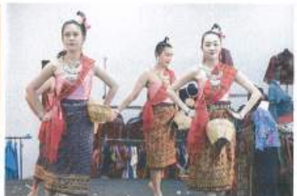
การแสดงเชิงกระหัง นักศึกษาสาขานาฏกรรมไทย คณะศิลปกรรมศาสตร์ มหาวิทยาลัยรามคำแหง