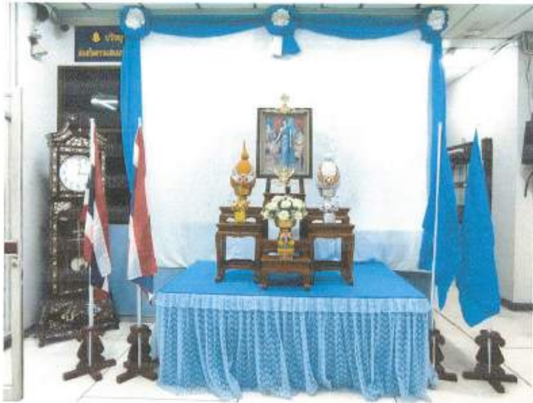
คณสมณุษยศาสตร์