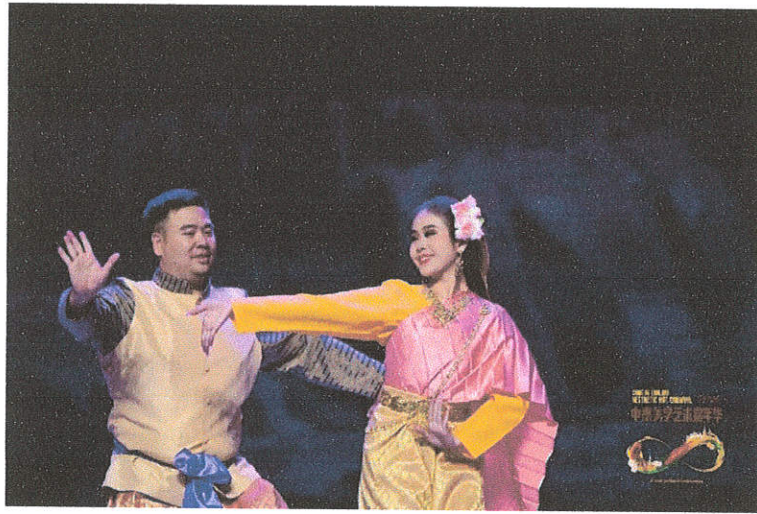
การแสดงระบำพื้นบ้าน “ภาคกลาง”