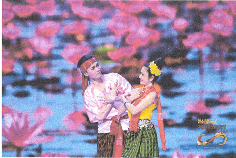
การแสดงระบำพื้นบ้าน “ภาคอีสาน”