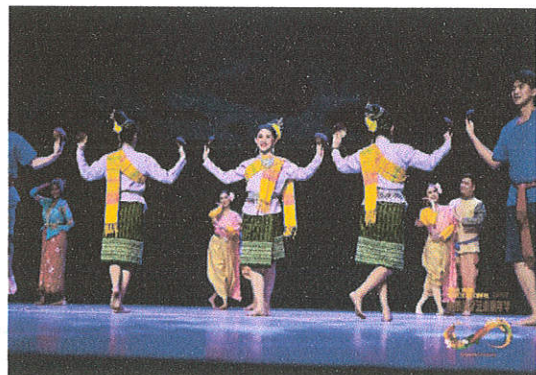
การแสดงระบำพื้นบ้านในแต่ละภูมิภาค