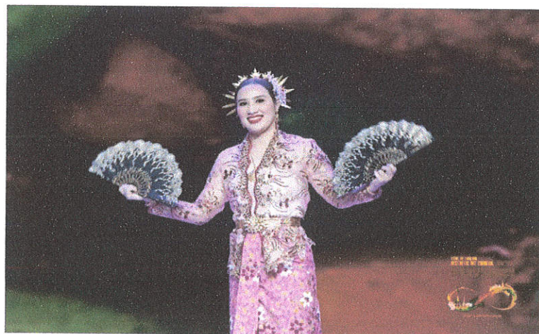
การแสดงระบำพื้นบ้าน “ภาคใต้”