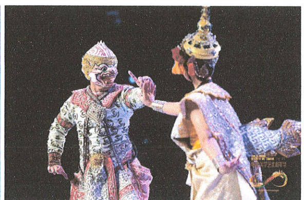
การแสดงโขน จากนิทาน “รามายณะ” ตอนจับนาง