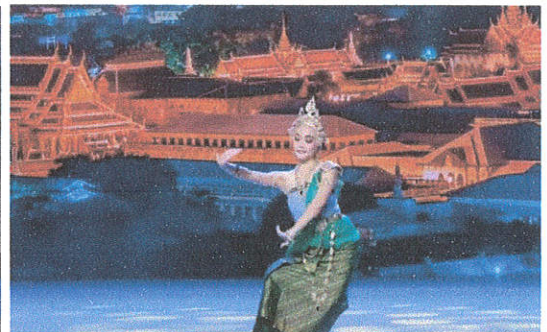
ระบำศรีวิชัย