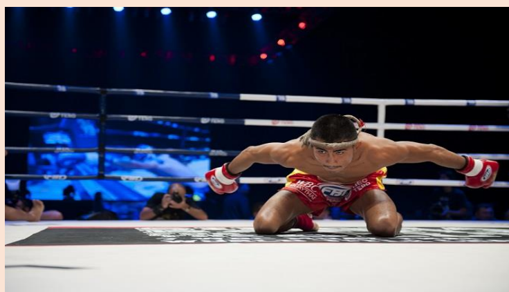
การไหว้ครูมวยไทย

พิธีไหว้ครูที่จัดขึ้นเป็นประจำทุกปี เป็นการแสดงออกถึงความกตัญญูต่อครูอาจารย์ เป็นวัฒนธรรมไทยแท้ที่สืบทอดมายาวนานอันจะเป็นพิธีใหญ่ จัดปีละครั้ง ตามแต่ครูจะกำหนด ในพิธีจะมีการตั้งโต๊ะแต่งเครื่องสังเวทเวทดา และบูชาครูอาจารย์ที่ล่วงลับไปแล้วทุกท่าน รูปแบบ และพิธีการไหว้ครูจะแตกต่างกันในแต่ละสำนัก แล้วแต่ครูอาจารย์ของสำนักนั้นกำหนดขึ้น และมีการปฏิบัติสืบทอดกันมา ประเพณีการขึ้นครู และพิธีครอบครูนับวันยิ่งค่อย ๆ เลือนหายไปตามกาลเวลา อันเนื่องมาจากสภาพสังคมในปัจจุบันที่เปลี่ยนไป และแตกต่างจากในอดีตมาก แต่ประเพณีการไหว้ครูมวยไทยก็ยังสามารถเห็นได้อยู่ในการแข่งขันมวยไทย ที่การแข่งขันจะมีการไหว้ครูมวยไทยเพื่อระลึกถึงบุญคุณของครูมวยไทยนั่นเอง