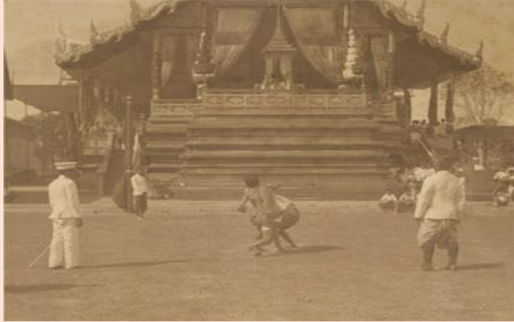
การชกมวยไทยหน้าพลับพลาที่ประทับพระบาทสมเด็จพระจุลจอมเกล้าเจ้าอยู่หัว ในงานพระศพ พระเจ้าบรมวงศ์เธอ พระองค์เจ้าอรุณวงศ์รัชสมโภช พ.ศ. ๒๔๕๒

เมื่อพระมหากษัตริย์โปรดการชกมวยไทยเช่นนี้ ทำให้มีการฝึกมวยไทยกัน อย่างแพร่หลายในราชสำนัก และขยายไปสู่บ้าน และวัด โดยเฉพาะวัด ถือเป็นแหล่ง ประสิทธิ์ประสาทวิชามวยไทยเป็นอย่างดี เพราะขุนศึกเมื่อมีอายุมากมักบวชเป็นพระ และสอนวิชาการต่อสู้ให้แก่ลูกศิษย์ที่ดี หรือมีความกตัญญูรู้คุณ โดยเฉพาะนักมวย เด่นในยุคหลัง ๆ ก็เกิดจากการฝึกฝนกับพระสงฆ์ในวัดแทบทั้งสิ้น เหตุนี้การฝึกมวยไทย จึงแพร่หลาย และขยายวงกว้างไปสู่สามัญชนมากยิ่งขึ้น